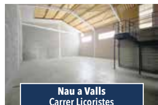
Nau a Valls Carrer Licoristes

NAU INDUSTRIAL AL POLÍGON diàfana amb bon accés. Superfície de 350 m2, oficines i serveis. 750€