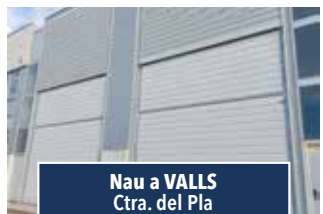
Nau a VALLS Ctra. del Pla

CASA PER A INVERSORS. Unifamiliar de 160 m2, 4 pl. exterior i amb façana a dos carrers. Ben orientada. Molt bonica i bona rentabilitat. 145.000€