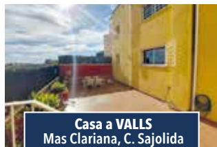
Casa a VALLS Mas Clariana, C. Sajolida

NAU CANTONERA amb pati davanter, De 216 m2 amb oficines i serveis. Altell de 34 m2. En perfecte estat per a iniciar activitat. 146.000€