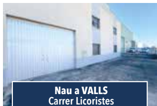
Nau a VALLS Carrer Licoristes

NAU INDUSTRIAL DE 900 m2 per iniciar activitat. Aigua, llum i alarma. Tel. sistema contraincendis, oficina i servei. Prestatgeries i toro. CONSULTEU