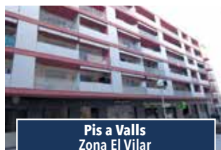
Pis a Valls Zona El Vilar

BONIC PIS TOTALMENT EQUIPAT de 2 habit. Exterior. Disposa d'aparcament. Edifici amb ascensor. 700€