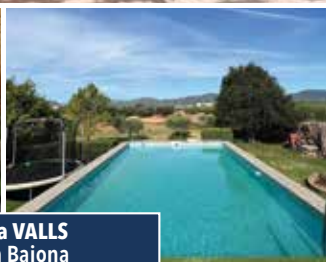
Xalet a VALLS Partida Baiona

XALET TOT PLANTA BAIXA, 3 hab., ampli menjador-cuina llar de foc i bany complet. Piscina, zona enjardinada, barbacoa, vestidors i magatzem. Oliveres, ametllers i altres arbres fruiters. Per viure-hi tot l'any. Bon accés. 245.000€