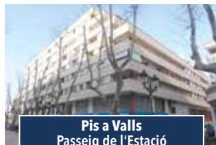
Pis a Valls Passeig de l'Estació

EDIFICI LANTANA. Cantoner de 4 hab. (1 suite), 2 banys, ampli menjador-terraceta, cuina off. Calef., pre-instal. a.c. Armaris enc. Possib. pq. 209.000€