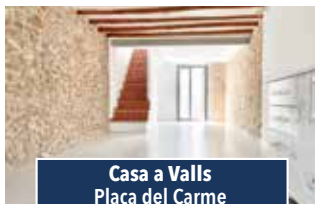
Casa a Valls Plaça del Carme

XALET TOT PLANTA BAIXA, 3 hab., ampli menjador-cuina llar de foc i bany complet. Piscina, zona enjardinada, barbacoa, vestidors i magatzem. Oliveres, ametllers i altres arbres fruiters. Per viure-hi tot l'any. Bon accés. 245.000€