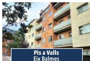
Pis a Valls Eix Balmes

NAU INDUSTRIAL AL POLÍGON diàfana amb bon accés. Superfície de 350 m2, oficines i serveis. 750€