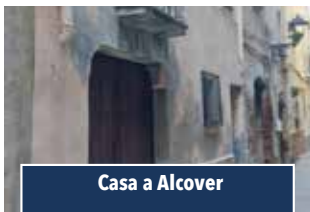
Casa a Alcover

PIS A VALLS. Primer pis reformat i ben orientat de 3 habitacions. Cantoner amb petita sortida i molt assolellat. 150.000€