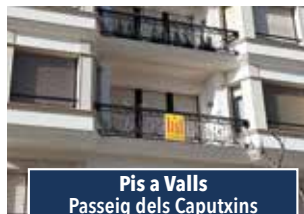
Pis a Valls Passeig dels Caputxins

PERRUQUERIA-ESTÈTICA. Local totalment condicionat per a iniciar negoci. Instal·lacions al dia amb tots els detalls. A la millor zona comercial de Valls. Consultar preu