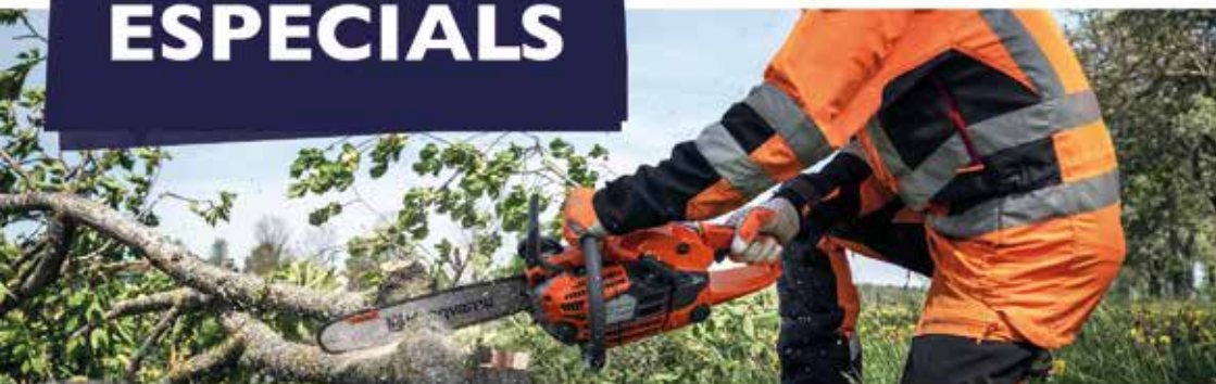
Motoserra HUSQVARNA 120 MARK II