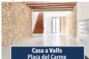
Casa a Valls Plaça del Carme

PIS EN EDIFICI EMBLEMÀTIC. De 230m2, edifici familiar. Estances grans i acabats de qualitat, 4 hab. (1 suite), bany complet i servei. Menjador amb balcó. 329.000€