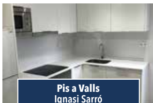
Pis a Valls Ignasi Sarró

CASA PER INVERSOR. De 160 m2 al centre del poble, reformada i molt bonica. Unifamiliar de 4 plantes, exterior i dona a dos carrers. Façana principal ben orientada. 145.000€