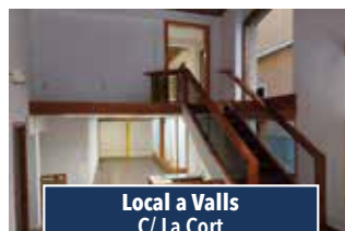
Local a Valls C/ La Cort

LOCAL CANTONER DE 149M2. Tot equipat, de dues plantes més soterrani. Idoni per restauració. 790€