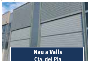
Nau a Valls Cta. del Pla

CASA AL CENTRE DEL POBLE. Disposa de garatge-magatzem i dos pisos independents. Necessita reforma. 60.000€