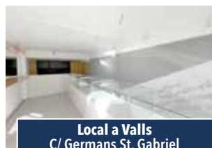
Local a Valls C/ Germans St. Gabriel

LOCAL VALLS. De 60m2 amb recepció, gran sala diàfana, arxiu i servei. Idoni per oficines. 390€