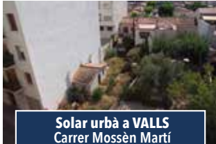
Solar urbà a VALLS Carrer Mossèn Martí

NAU PER INICIAR ACTIVITAT. Nau industrial de 900m2 amb aigua, llum, alarma i tel. Disposa de sistema contraincendis, oficina i servei. Prestatgeries i toro. Consultar preu