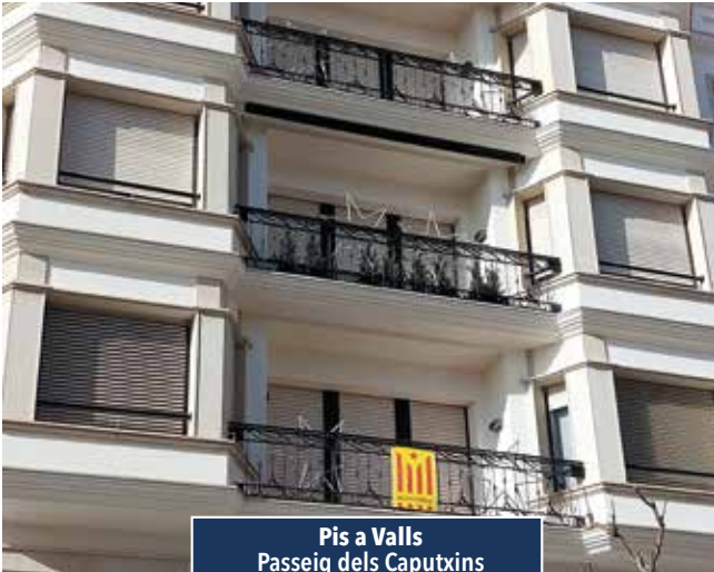
Pis a Valls Passeig dels Caputxins

PIS MOLT BONIC DE 230 m2. Es situa en un edifici familiar, es distribueix en una sola planta. Estances grans i acabats de qualitat. 4 habitacions, una tipus suite, bany complet i servei. Menjador estar amb balcó al passeig, espectacular cuina-office amb rebost i terrasseta. Ascensor i pàrquing. Consultar preu