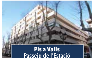
Pis a Valls Passeig de l'Estació

XALET TOT PLANTA BAIXA, 3 hab., ampli menjador-cuina, llar de foc i bany complet. Piscina, zona enjardinada, barbacoa, vestidor i magatzem. Oliveres, ametllers i arbres fruiters. 245.000€