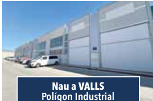
Nau a VALLS Polígon Industrial

EDIFICI LANTANA. Cantoner de 4 habitacions (1 suite), 2 banys. Ampli menjador amb terrasseta, cuina office. Calefacció, pre-instal·lació d'aire. Armariers encastats. En molt bon estat. 209.000€