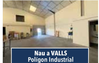
Nau a VALLS Polígon Industrial

SOLAR URBÀ PER EDIFICAR. Possibilitat de construir-hi una casa amb jardí al centre del poble. 150.000€