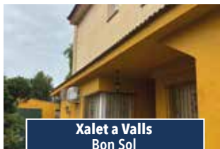
Xalet a Valls Bon Sol

REBAIXADA. Nau industrial de 1.500m2, disposa de pati davanter. Idònea per magatzem logístic. 2.000€