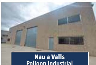
Nau a Valls Polígon Industrial

REBAIXADA. Nau industrial de 1.500m2, disposa de pati davanter. Idònea per magatzem logístic. 2.000€