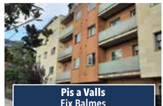
Pis a Valls Eix Balmes

XALET A BON SOL Xalet amb jardí i barbacoa. Molt espaiós. De dues plantes. Calefacció. Consulteu preu