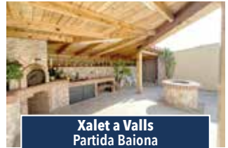
Xalet a Valls Partida Baiona

PIS MOLT BONIC DE 230 m2. Es situa en un edifici familiar, es distribueix en una sola planta. Estances grans i acabats de qualitat. 4 habitacions, una tipus suite, bany complet i servei. Menjador estar amb balcó al passeig, espectacular cuina-office amb rebost i terrasseta. Ascensor i pàrquing. Consultar preu