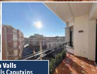
Pis a Valls Passeig dels Caputxins

PIS molt bonic de 230m 2 , en un edifici familiar, distribuït en una sola planta. Estances grans i acabats de qualitat. Una tipus suite, bany complet i servei. Menjador estar amb balcó al passeig, espectacular cuina-office amb rebost i terrasseta. Ascensor i pàrquing. Consultar preu