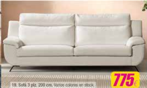
19. Sofá 3 plz. 200 cm. Varios colores en stock.