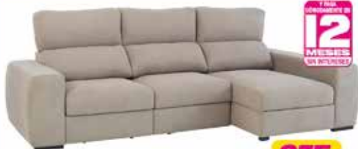
16. Sofá chaiselongue 290 cm. Sistema extraíble. Varios colores en stock.