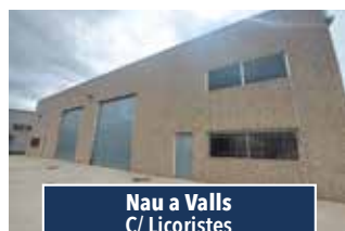
Nau a Valls C/ Licoristes

NAU AMB SOLAR DAVANTER. Nau aïllada de 1.500m 2 . Idònea per magatzem logístic. 2000€