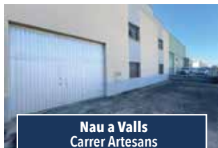
Nau a Valls Carrer Artesans

CASA PER REFORMAR, CANTONERA. Al centre del poble en zona cèntrica. 85.000€