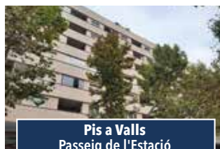
Pis a Valls Passeig de l'Estació

DÚPLEX DE 2 HABITACIONS. Cuina, menjador amb balcó. Terrassa i sala diàfana. 650€