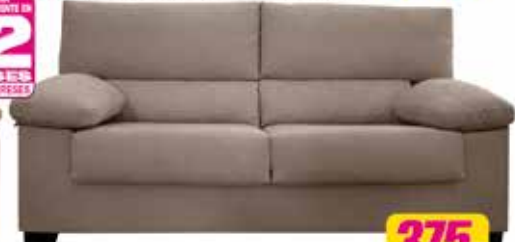
23. Sofá 3 plz. Naxos 190 cm. Varios colores en stock.

Y PAGA CONCORDANTE EN 12 MESES SIN INTERÉS