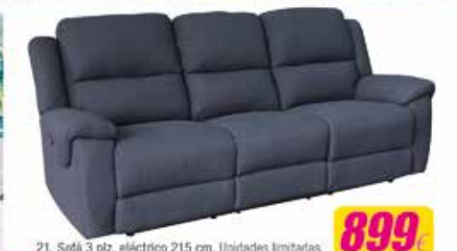
21. Sofá 3 plz. eléctrico 215 cm. Unidades limitadas.