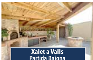
Xalet a Valls Partida Baiona

PIS molt bonic de 230m 2 , en un edifici familiar, distribuït en una sola planta. Estances grans i acabats de qualitat. Una tipus suite, bany complet i servei. Menjador estar amb balcó al passeig, espectacular cuina-office amb rebost i terrasseta. Ascensor i pàrquing. Consultar preu