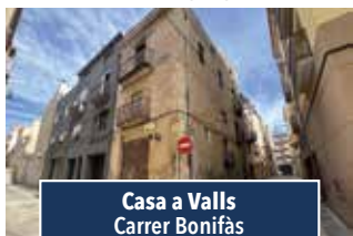
Casa a Valls Carrer Bonifàs

XALET AMB PISCINA. Tot a planta baixa, 3 hab., cuina-menjador-llar de foc. Bany c., piscina, z. enjardinada, barbacoa, vestidor i magatzem. Oliveres, ametllers i fruiters. 245.000€