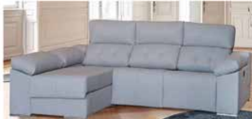
18. Sofá chaiselongue 300 cm. Dos asientos eléctricos, puff y arcón.