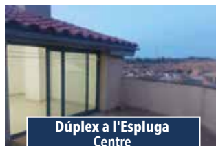
Dúplex a l'Espluga Centre

NAU AMB SOLAR DAVANTER. Nau aïllada de 1.500m 2 . Idònea per magatzem logístic. 2000€