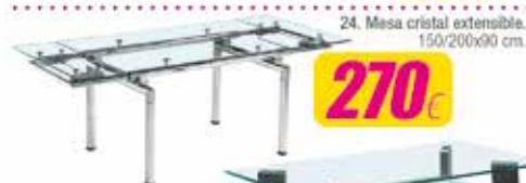
24. Mesa cristal extensible. 150/200x90 cm.