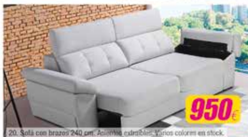
20. Sofá con brazos 240 cm. Asientos extraíbles. Varios colores en stock.