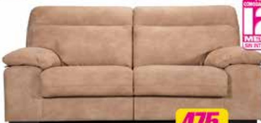
22. Sofá 3 plz. 200 cm. Varios colores en stock.