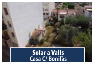
Solar a Valls Casa C/ Bonifàs

NAU CANTONERA AMB SOLAR. De 216m 2 amb oficines i serveis. Pati davanter i altell de 34m 2 , situada al c/ principal del Polígon. Per iniciar activitat. 146.000€