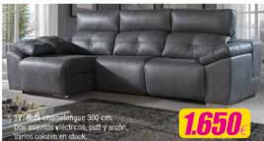
17. Sofá chaiselongue 300 cm. Dos asientos eléctricos, puff y arcón. Varios colores en stock.

Y PAGA CONCORDANTE EN 12 MESES SIN INTERÉS