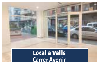
Local a Valls Carrer Avenir

PIS EN EDIFICI EMBLEMÀTIC de 230 m2, 4 habitacions (1 suite), espaiós, menjador amb balcó al passeig, cuina office, en perfecte estat. Amb mobles i electrodomèstics. Amb ascensor. Aparcament inclòs. Escala familiar i molt lluminós. CONSULTEU PREU