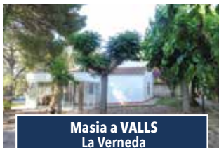
Masia a VALLS La Verneda

CASA AMB PATI I GARATGE. Molt bonica, zona Vallvera. Pati, garatge i gran terrat. 4 hab., menjador, cuina off., bany c. i servei. Per entrar-hi tot! 315.000€