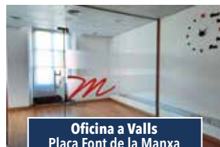
Oficina a Valls Plaça Font de la Manxa

NAU INDUSTRIAL INDEPENDENT de 1.500 m2. Disposa de pati posterior. Idonia per a magatzem. 2.500€