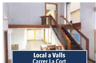
Local a Valls Carrer La Cort

LOCAL CANTONER de 149 m2, equipat, 2 banys, soterrani, lluminós i tocant al Museu Castellèr. Idoni per a restaurant. 790€