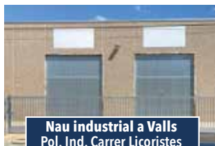
Nau industrial a Valls Pol. Ind. Carrer Licoristes

LOCAL CANTONER de 149 m2, equipat, 2 banys, soterrani, lluminós i tocant al Museu Castellèr. Idoni per a restaurant. 790€