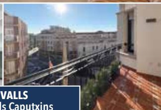
Pis a VALLS Passeig dels Caputxins

PIS EN EDIFICI EMBLEMÀTIC de 230 m2, 4 habitacions (1 suite), espaiós, menjador amb balcó al passeig, cuina office, en perfecte estat. Amb mobles i electrodomèstics. Amb ascensor. Aparcament inclòs. Escala familiar i molt lluminós. CONSULTEU PREU