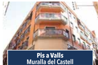
Pis a Valls Muralla del Castell

BONICA MASIA de planta baix, 3 hab., menjador i cuina. Porxo i piscina. Parcel·la de 750 m2. A 5 min. de Valls. Ideal per viure-hi tot l'any! 159.000€