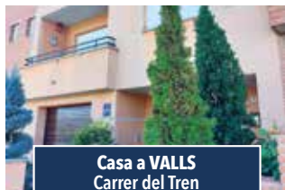
Casa a VALLS Carrer del Tren

LOCAL CANTONER de 45 m2, equipat, molt lluminós, amb molta llum i visibilitat. Per iniciar activitat. A la millor cantonada cial. de Valls! 120.000€