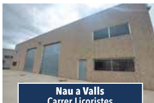
Nau a Valls Carrer Licoristes

NAU INDUSTRIAL AILLADA de 1.500m2, disposa de pati davanter. Idònea per magatzem logístic. 2.500€