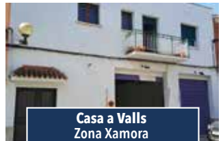
Casa a Valls Zona Xamora

PIS DE 230M2 . Amb 4 hab. (1 suite) espaiós, menjador amb balcó. Cuina- off., equipat amb mobles i electr. Un habitatge per planta. CONSULTAR PREU