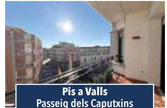
Pis a Valls Passeig dels Caputxins

XALET TOT PLANTA BAIXA , 3 hab., ampli menjador-cuina llar de foc i bany complet. Piscina, zona enjardinada, barbacoa, vestidors i magatzem. Oliveres, ametllers i altres arbres fruiters. Per viure-hi tot l'any. Bon accés. 245.000€