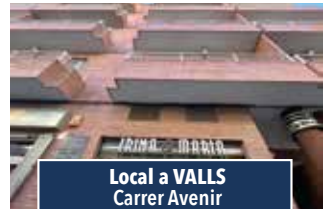
Local a VALLS Carrer Avenir

NAU CANTONERA amb pati davanter, De 216 m2 amb oficines i serveis. Altell de 34 m2. En perfecte estat per a iniciar activitat. 146.000€