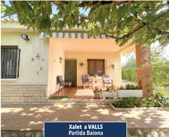
Xalet a VALLS Partida Baiona

XALET TOT PLANTA BAIXA , 3 hab., ampli menjador-cuina llar de foc i bany complet. Piscina, zona enjardinada, barbacoa, vestidors i magatzem. Oliveres, ametllers i altres arbres fruiters. Per viure-hi tot l'any. Bon accés. 245.000€