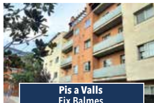
Pis a Valls Eix Balmes

NAU INDUSTRIAL AILLADA de 1.500m2, disposa de pati davanter. Idònea per magatzem logístic. 2.500€