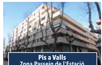
Pis a Valls Zona Passeig de l'Estació

BONIC PIS TOTALMENT EQUIPAT de 2 habitacions i exterior. Disposa d'aparcament. Edifici amb ascensor. 700€