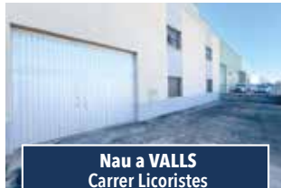
Nau a VALLS Carrer Licoristes

PIS, APARCAMENT I TRASTER . Pis de 3 habitacions (1 suite), ampli menjador i bonica cuina. Edifici de recent construcció amb ascensor. 135.000€