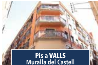
Pis a VALLS Muralla del Castell

CASA AMB LOCAL DE 80M2 . Casa de 3 habitacions amb terrassa, menjador i cuina a la primera planta. 179.000€